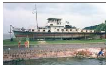
FK-312 néven a balatonboglári mólón

közben Alexandra név- re átkelesztelt – gőzha- jó visszakertült Dunára. 1893-ban átépítették, oldallapátjait leszerel- ték. 1898-ban – már Mohács néven –, mint Rosenfeld Simon hajó- ját említik a források. 1911-ben a Budapesti székhelyű Kavicszállí- tó Vállalat vásárolta