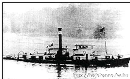
IRMA néven a Dunán