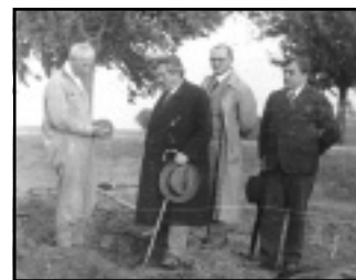
Móricz Zsigmond vidéken (középen az író)

Móricz Zsigmond a csoportképen. Somogyban látogatott meg egy termelő szövetkezetet a Tanácsköztársaság idején (1919), és agitál a szövetkezés mellett. A cikk idézi a Tanácsköztársaság földrendelését: „Minden közép- és nagybirtok minden tartozékával ... a proletár állam tulajdonába megy át. ... A köztulajdonba átvett földbirtokok szövetkezeti kezelésre a földet művelő mezőgazdasági proletárságnak adatik át.”