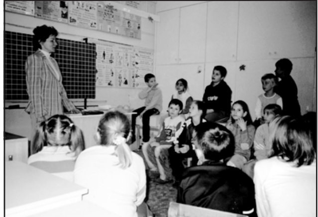
Az egészséges fogak

November 23-án a Tessedik Sámuel Főiskola Pedagógiai Főiskolai Kar Gyakorló Általános Iskolájában a 3. és 4. osztályos tanulók az ÁNTSZ által szervezett Fogszuvasodás megelőzési program keretében egy rövid filmet láthattak a gyermekkorú szájalpolásról, melyet interaktív beszélgetés követte a fogszuvasodás megelőzéséről. A programot vetélkedő, valamint a fogápoláshoz használatos apró jutalomtárgyak átadása zárta. A 4. osztályosok eddigi tapasztalataikat az alábbiak szerint foglalták össze: