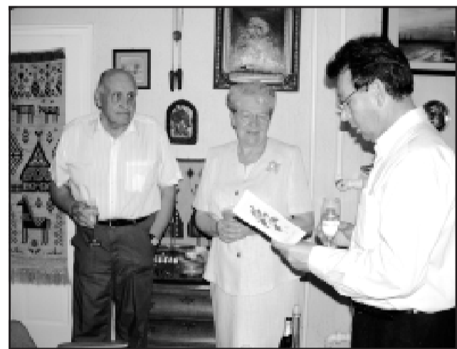
A polgármester köszöntője