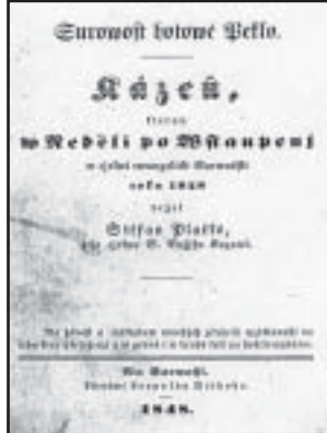
Egy korai Réthy-kiadvány 1847-ből, és egy szlovák nyelvű kötet címlapja