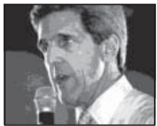
Az elnökjelölt ígér

Az abszolút jóindulatú, és ke- ves titkárnő ma reggel a háború- ról beszélt nekem. A hír, ami mi- att a téma felmerült, John Kerry kijelentése, miszerint ha megvá- lasztják, egész Jeruzsálembet a zsi- doknak kellene adni.