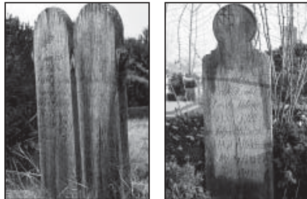
Kollár Mihály, ↑ 1940

Fejfák az Újtemetőből (a továbbiakban a nevek alatt feltüntetett évszám a ↑ jelével a síremléken feltüntetett elsőként elhunyt személy halálának évét, a ↑ jel nélküli évszám pedig a sírkő állításának idejét jelöli):