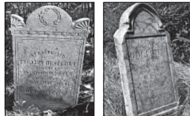
Tabajdy Örszébet, ↑ 1848