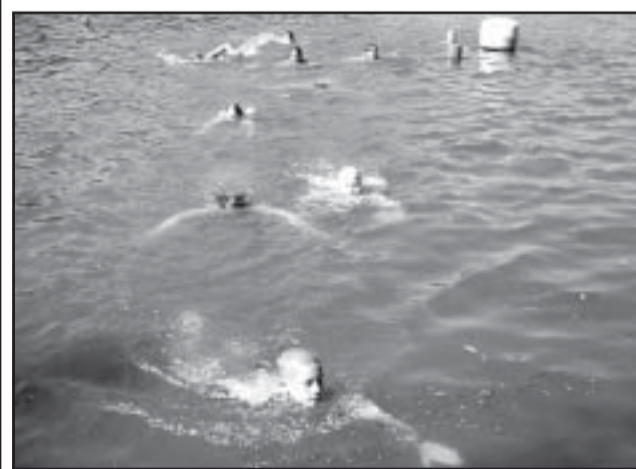
Sorra érkeztek célba a versenyzők