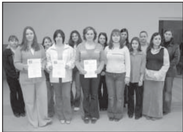
A döntős versenyzők, előtt a dobogós lányok

Tavasszal a versenyek időszakát éljük. A Vajda Péter Gimnázium és Szakközépiskola ügyvitel szakos tanulói számára ez az időszak mindig az intenzív felkészülés, a reménykedés időszaka. Ugyanis ilyenkor rendezik meg az Országos Gépiró- Gyorsíró- és Szövegszerkesztő Bajnokságot, ami a szakmát művelők legrangosabb hazai versenye. Aki itt helytáll, biztosan megkapja a nemzetközi versenyekre, illetve a soron következő világbajnokságra.