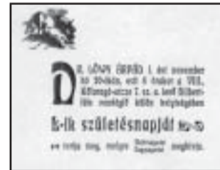
Meghívó 50. születésnapjára

Aki ismertük a költőt, a szorgalmasan tanuló tudóst, a melegszívű embert, az őszinte barátot, a bohém örökifjút, mi e versek