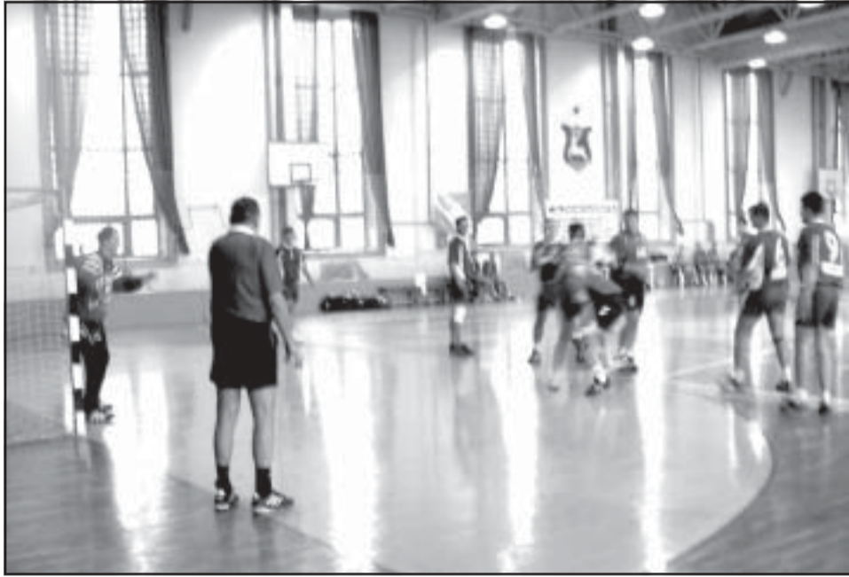
A szarvasi férfiak számára igazán jól indult a megyei pontvadászat, mivel mindkét eddigi mérkőzésüket megnyerték

Bekapcsolódott a megyei kézilabda-bajnokság küzdelmeibe az egykor NB I. B-ben is szereplő HC Szarvas férfi együttese, amely bemutatkozásképpen Gyulán nyert egy góllal, majd a hétvégi hazai mérkőzését is gond nélkül vette a Mezőhegyes ellenében. A hölgyeknél változatlanul jól szerepelnek a békésszentandrásiak, akik kielezített csatában