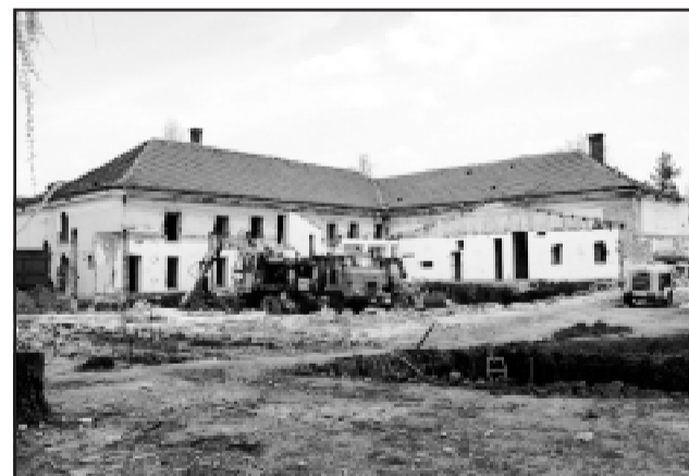
A fürdő épülete az udvar felől 2003 tavaszán, közel az eredeti állapotában