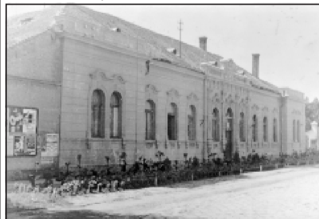
A fürdő épülete 1960 körül