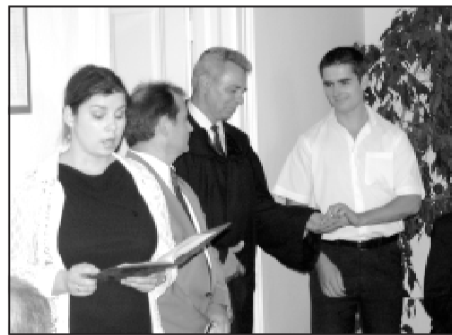
A filemüle, a bíróság dolgozóinak előadásában