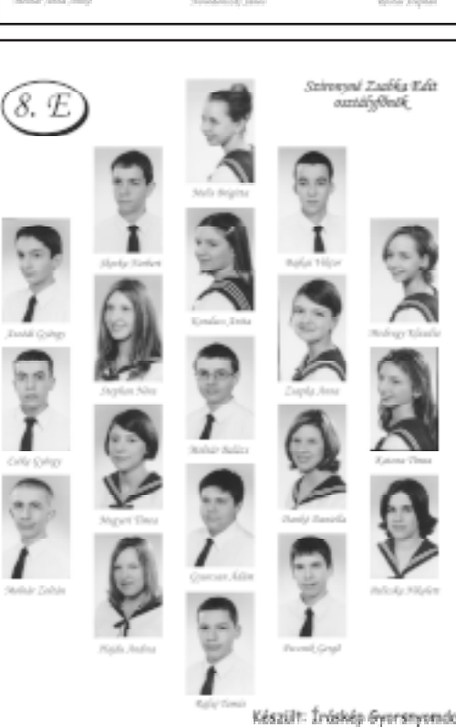
Készült: Iráskép Gyorsnyomda