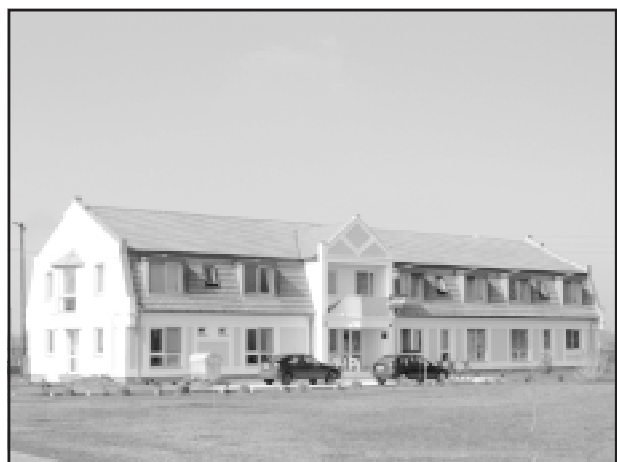
Nagyszénási Szociális Otthon Rehabilitációs részlege