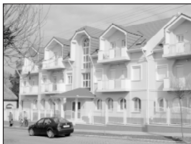
Szarvas, Vasút utcai 12 lakás