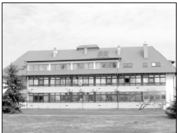
Halászlati és Öntözési Kutatóintézet szarvasi irodaépület

ALAPÍTVÁ: 1982-ben EGY MEGBÍZHATÓ PARTNER AZ ÉPÍTŐIPARBAN