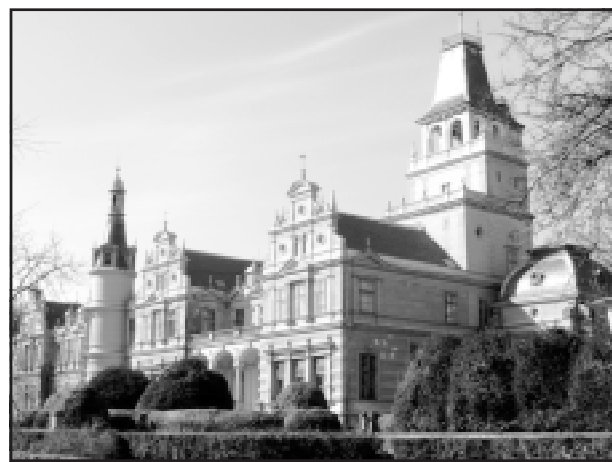
Szabadkígyósi Wenckheim kastély felújítása