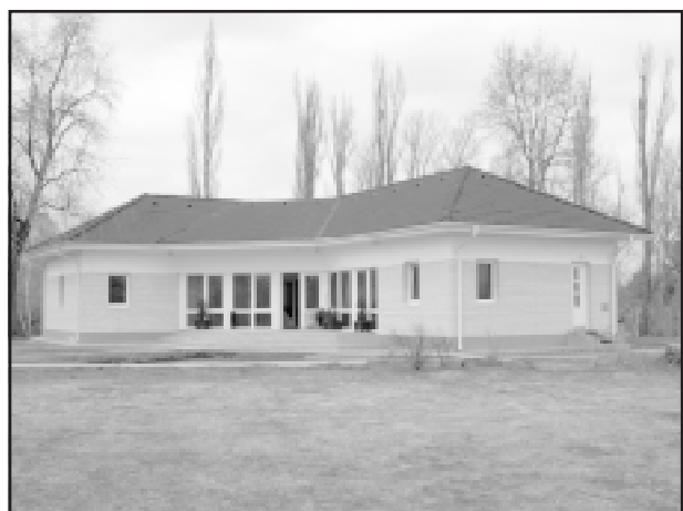
Szarvasi Mezőgazdasági Kutató Fejlesztő Kht. növényfeldolgozó