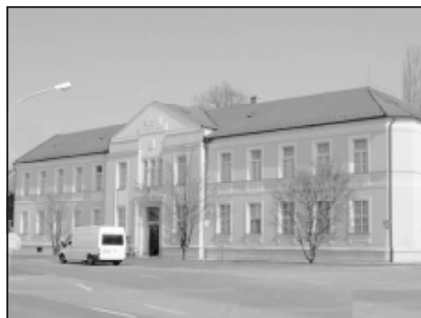
Orosházi Városi Bíróság – rekonstrukció