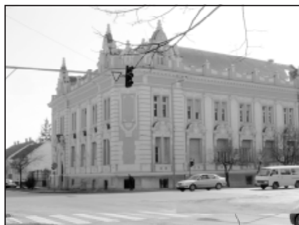
Magyar Államkincstár Békéscsabai Fiók – rekonstrukció –

Szarvasi Vajda Péter Gimnázium bővítés és rekonstrukció Szarvason (Rózsa F. utcában és Zrínyi utcában) 36 db önkormányzati szociális bérlakás Szarvasi Vajda Péter Gimnázium tornacsarnok Szarvasi Szlovák Általános Iskola, Óvoda és Diákotthon