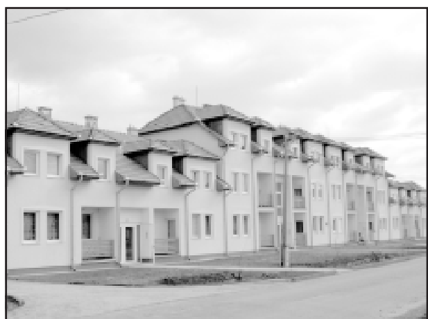
Önkormányzati szociális bérlakások (20 db) Szarvason a Vágóhíd utcán