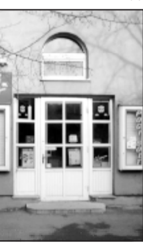
A Szabadság u. 12. szám alatti Pogi boltban gyakran megfordulnak a főiskolások

- Apró Karácsony: hogyan alakul ekkor a nyitvatartásuk, rendelhetünk-e Szentestére süteményt? - Természetesen! Szenteste napján, sőt Szilveszter napján is nyitva tartunk, délelőtt 11 óráig. Így aki előző nap leadja a rendelését, annak a délelőtti folyamán megsütjük a friss fernetit, pogácsát... Más napokon egyébként reggel héttől délután fél hatig folyamatos a nyitvatartásunk, egész nap várjuk vásárlóinkat mindkét üzletünkben. (X)