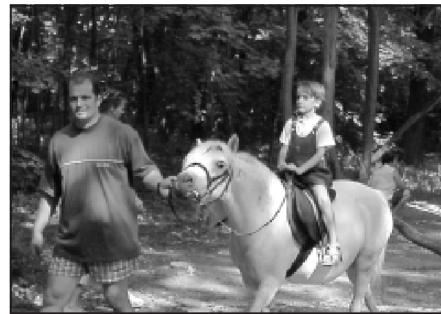
A kisgyermek számára is akadt szórakozás a ligetben, például a pónilovaglás. Kép és szöveg: L.J.