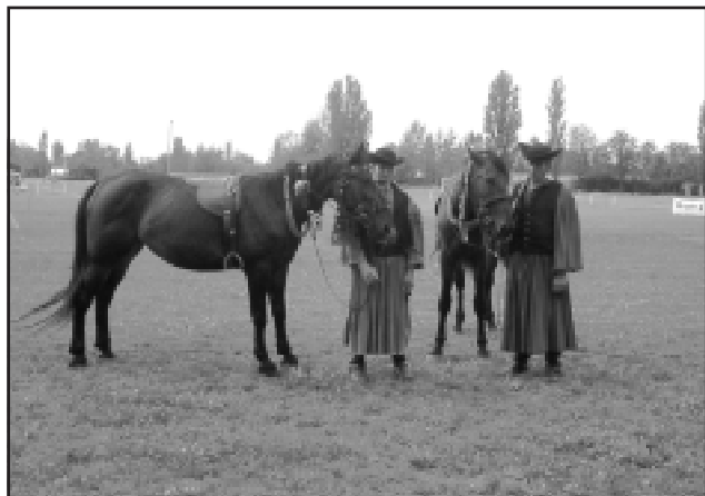
Bár lapunk nem színes, de higgyék el, úgy van, ahogy a nótámondja: "a csikósok, a gulyások kék lajbiban járnak."

Programokban a második napon – vasárnap – sem volt hiány: délelőtt a kisgyermekes családokat várták a színpad elé, ahol "Paprika Jancsi" címmel egy vásári bábjátékot mutattak be. Utána a Tessedik Táncgyűttes műsorát, majd a DÚVÓ zenekar népzenei koncertjét hallhatta és láthatta a közönség. Ezen a napon magyar pásztorok fajtája és ügyességi bemutatója is sor került.