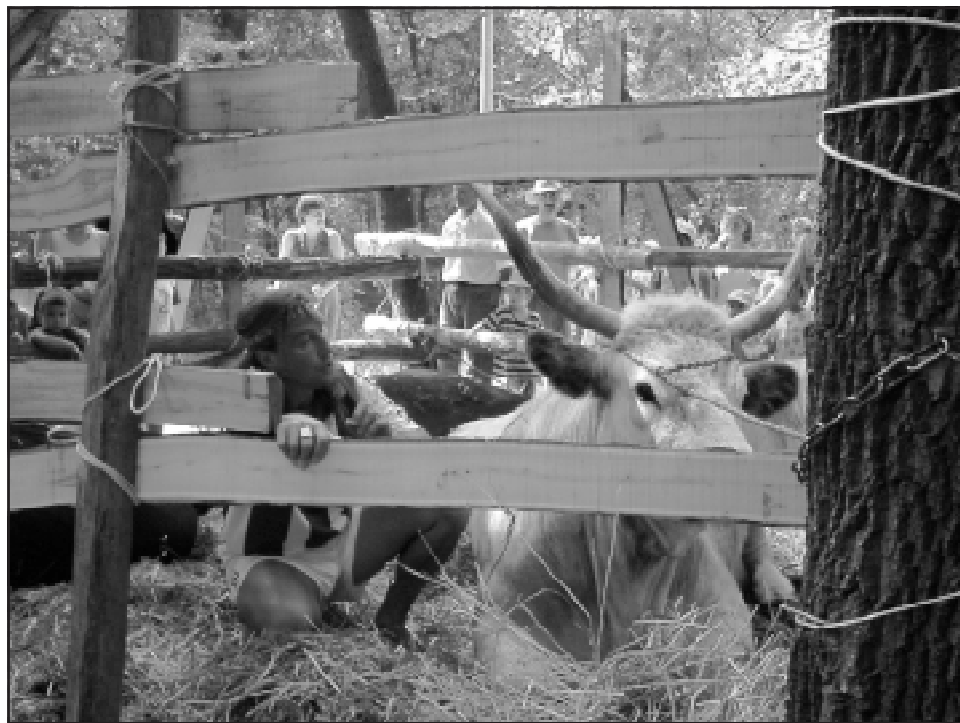
A magyar puszta jellegzetes állata, a szürkemarha – ezúttal karámba zárva.

Választani tehát bőven volt miből, sőt aki táncos kedvében volt, az egészen éjfélig rophatta a szombat esti lovashálon. A kétnapos szarvasi rendezvényre ezúttal – a Magyar Tourinform Rt bécsi képviselete valamint a Dél-Alföldi Regionális Marketing Igazgatóság szervezésében – 22 osztrák újságíró is ellátogatott, akik minden bizonnyal híret visznek majd Ausztria minden tájára városunk immár hagyományos rendezvényének.