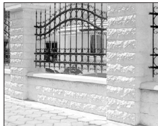
Kerítés burkolat CLASSIC típusú kövel