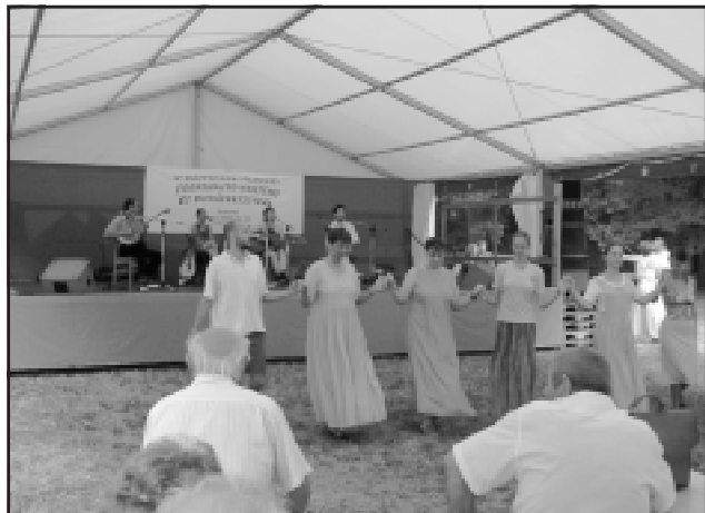
A Mascarades görög zenekar koncertjén a szarvasi közönség is táncra perdült.