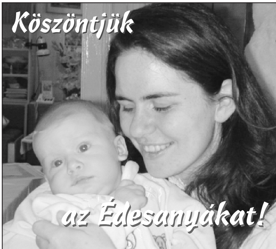
Anyák napi összeállításunk a 8. oldalon